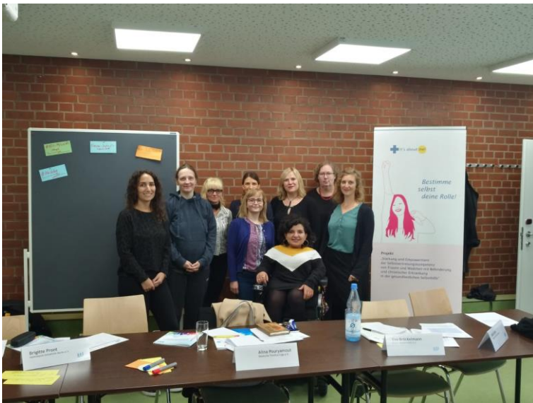
Empowert: Teilnehmer*innen der Frauen-Zukunftswerkstatt

am 27. September 2019 im Jugendgästehaus Hauptbahnhof Berlin, Lehrter Straße 68, 10557 Berlin